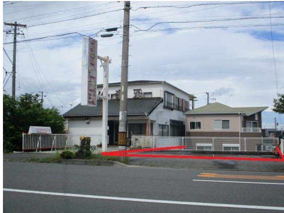
県道側からの現地写真